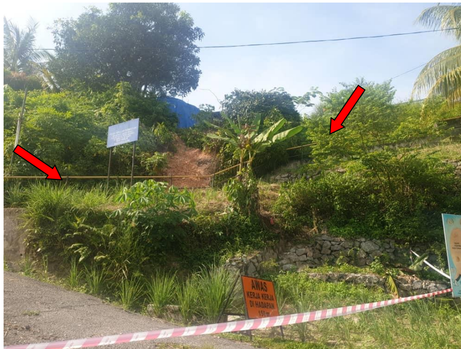
Laluan pejalan kaki juga rosak akibat runtuhan