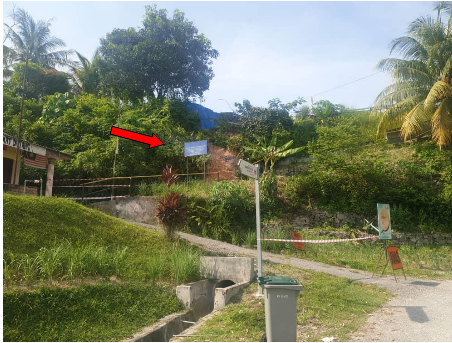
Keadaan tebing runtuh dari bahagian bawah