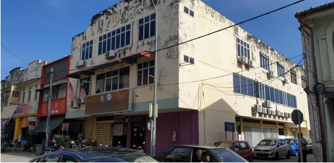
Keadaan di bahagian luar bangunan pasar lama.