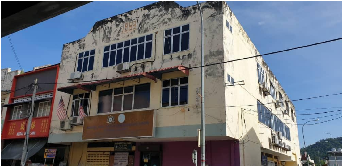
Pandangan hadapan bangunan pasar lama.