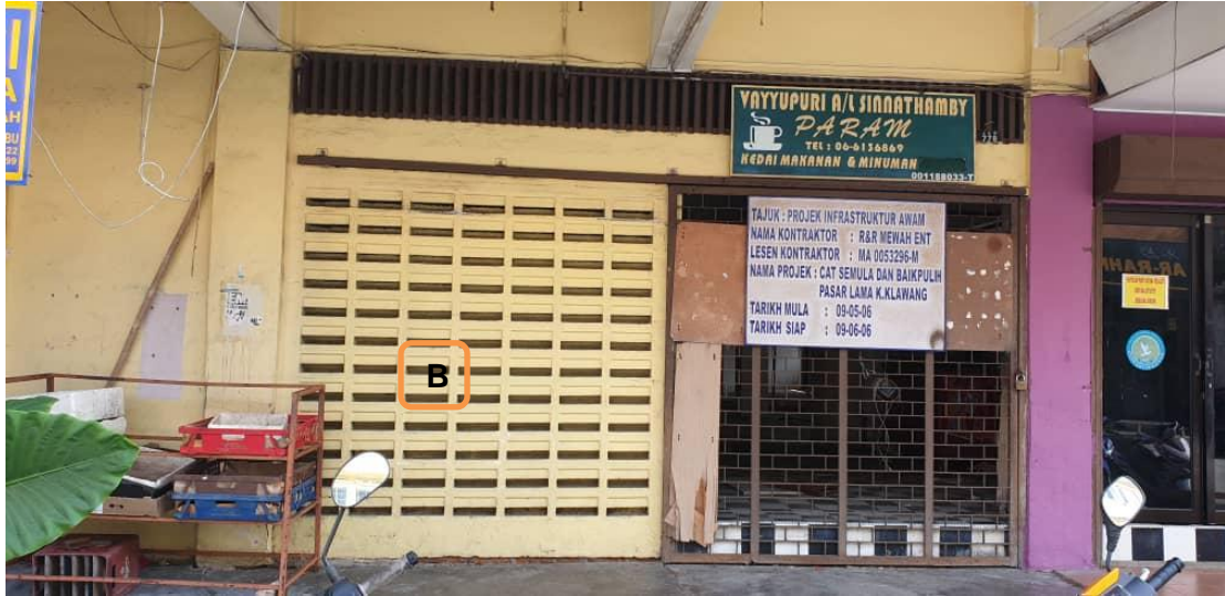
(B) Laluan masuk utama di bahagian hadapan akan dinaiktaraf.