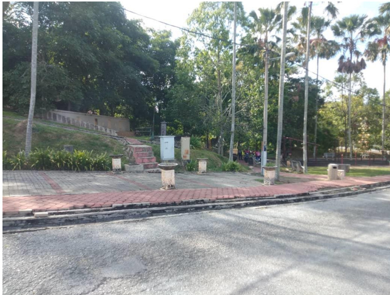
keadaan taman awam dari sudut tempat letak kenderaan