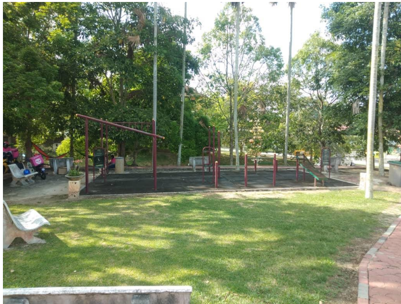
Keadaan taman awam dari sisi tempat alatan senaman