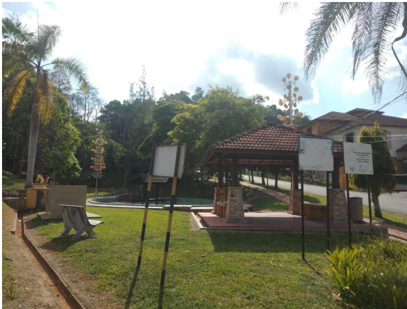
Kedaaan taman awam dari hadapan

Dikeluarkan Oleh: Bahagian Perancangan dan Landskap, Majlis Daerah Jelevu, Negeri Sembilan