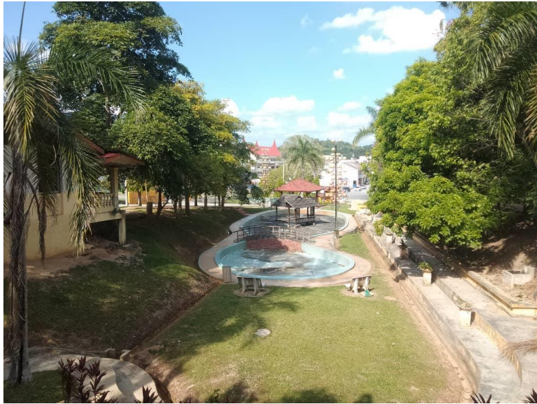
Kedaaan taman awam dari bahagian belakang