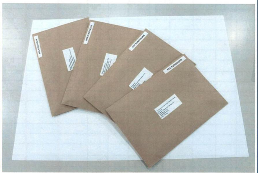
PEMOHON HANTAR TERUS KE PEMBEKAL UTILITI & JABATAN BERKAITAN